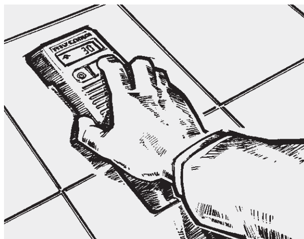
Nivellement facilité grâce au maniement à une seule touche (utilisation caractéristique de l'appareil mobile)

L'appareil est constitué d'un dévidoir-enrouleur compact avec manivelles escamotables et d'un tube spécial et l'appareil mobile est constitué d'un affichage et d'une touche. Le module de mesures de précision intégré à l'appareil mobile mesure la différence de pression du liquide entre le tambour et l'appareil mobile.