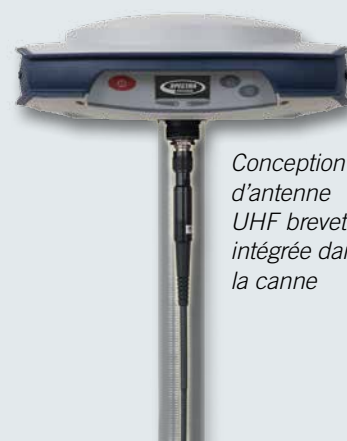
Conception d'antenne UHF brevetée intégrée dans la canne